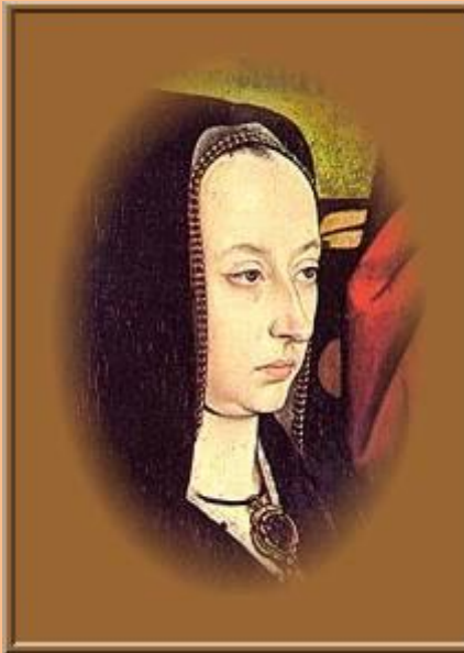
Anne de Beaujeu

Anne de Beaujeu s'attaque ensuite à l'élargissement du royaume en réglant la succession de Bretagne. François II