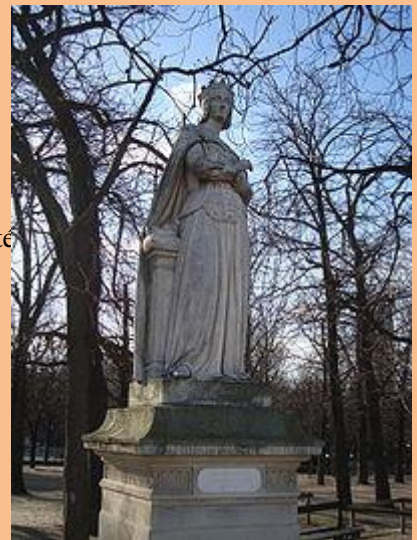
Statue d'Anne de Beaujeu dans la série des Reines de France et Femmes illustres du jardin du Luxembourg.

Dans un même temps, Anne de Beaujeu doit faire face à l'agitation des grands féodaux du sud-ouest du royaume. Ces derniers croient pouvoir affirmer leur indépendance lors de la régence : ils sont très rapidement mis au pas par cette femme énergique.